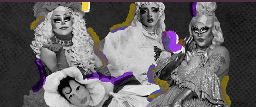
SHOW DRAG ESPECTACULAR

Desde stand up, burlesque, fantasía y shows que te sacarán las lágrimas, el arte del drag tiene una gran variedad de propuestas que llenarán el escenario de magia y sobre todo de lentejuelas. Un show de variedrag para todxs lxs que disfrutan del drag en todo su esplendor.